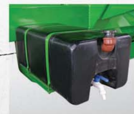
Tanque de agua limpia Provisto de un tanque para agua de 40 lts. de capacidad.