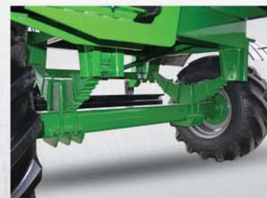
Tren delantero y Eje trasero Avantren con aro bolitas. Ejes con puntas desmontables. Amortiguación con elásticos.