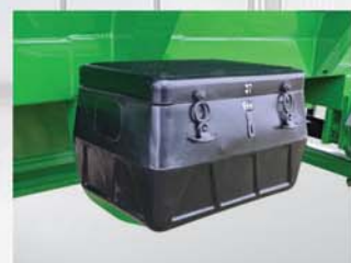
Cajón de herramientas.