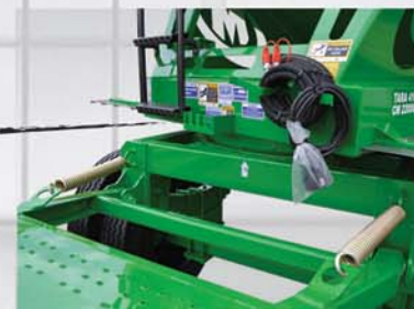
Chasis fabricado con estructura tubular de alta resistencia.