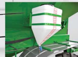
Depósito de inoculantes Depósito inoculador de semillas de 17 lts.

Destape Cobertor de lona rebatible a manivela de rápida ejecución de maniobra para cubrir y proteger el interior de la misma.