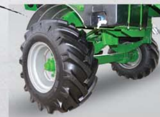
Rodados 4 llantas para neumáticos 16.0/70 x 20