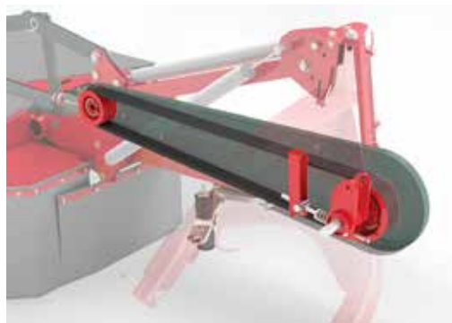
Amortiguador de golpes.