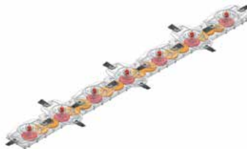
Barra de corte bañada en aceite – mayor durabilidad.